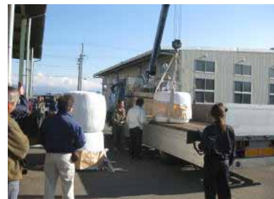
ロールベール運搬器具実証会