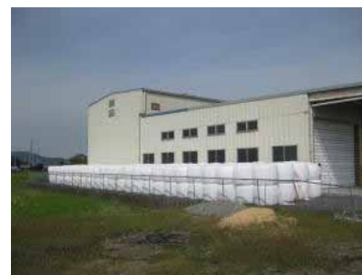
収穫後はJA施設で一時保管