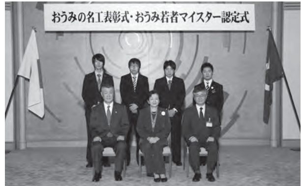
▲11月7日認定式（県公館）