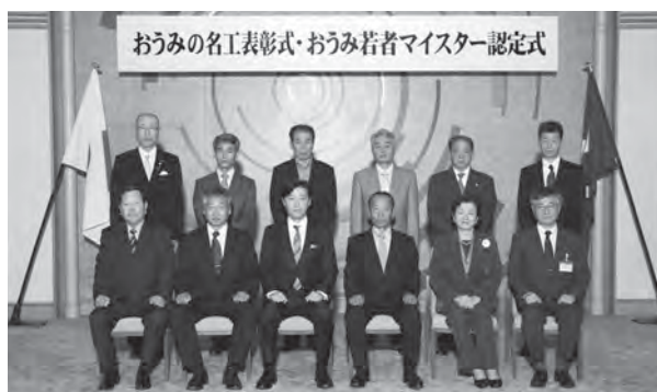
▲11月7日表彰式（県公館）