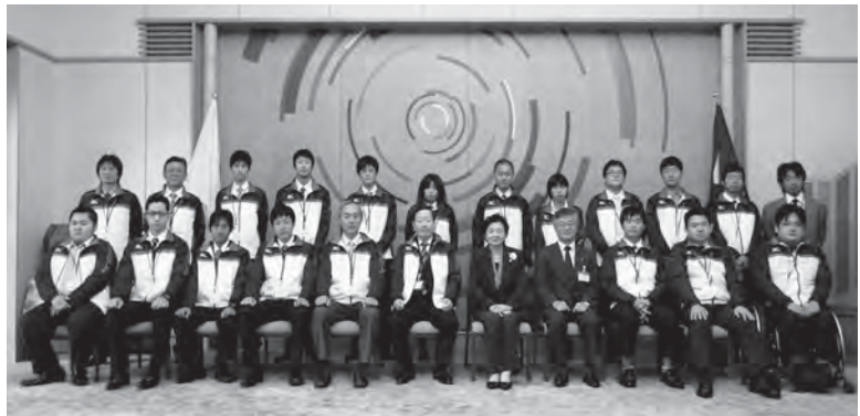
▲11月5日 合同結団式（県公館）

千葉県において、第51回技能五輪全国大会および第34回全国障害者技能競技大会（アビリンピック）が盛大に開催されました。両大会とも滋賀県代表選手が見事入賞を果たし、今後の活躍が期待されます。