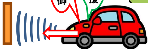
低速衝突軽減ブレーキ機能(前進時/後退時)