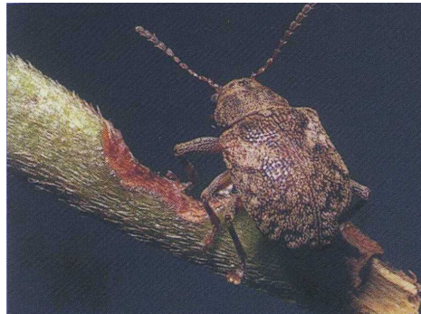
マダラカサハラハムシ成虫 (体長4mm)