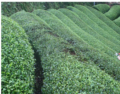
被害を受け局所的に枝枯れの生じた茶園