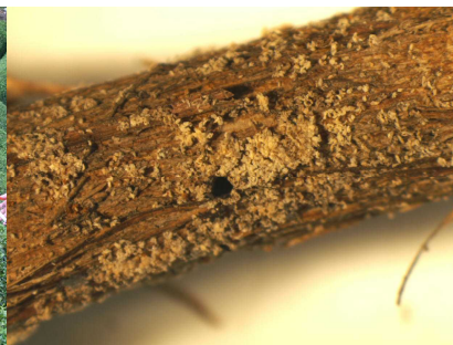
シイノコキクイムシの侵入跡 (枝には直径1mm程度の丸い穴が確認でき、周辺には木くずや糞が観察されることが多い。)