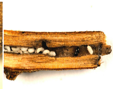
孔道内に生息する成虫・幼虫