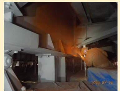
【中はこうなっています!】