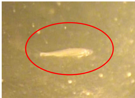
図2 第一湖盆で確認したホンモロコ