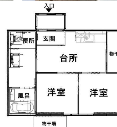
2~3人用 (車いすタイプ)