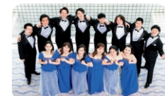
びわ湖ホール声楽アンサンブル