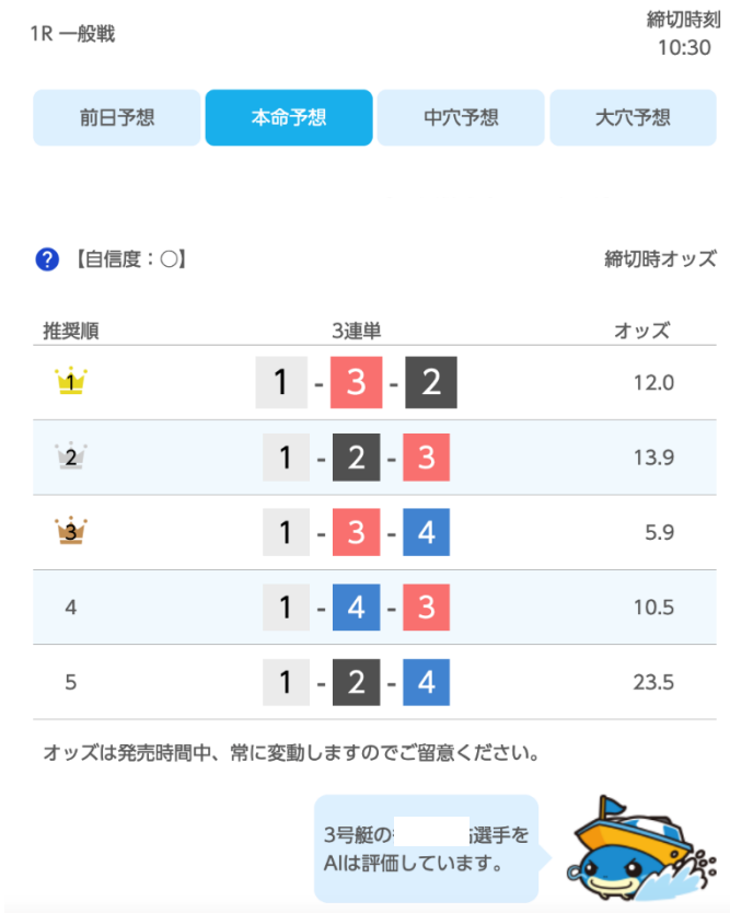
AIによる総合評価(本命予想) 1R

また、レース当日の気象情報などの追加情報を元に、各レースの開始前に3連単について「本命予想」「中穴予想」「大穴予想」の3種類を提供いたします。また、「選手特性」「モーター特性」などそれぞれの算出根拠をグラフ化し、AIが何に基づいてその選手を評価をしているのか、できるだけわかりやすくご提供することを目指しています。