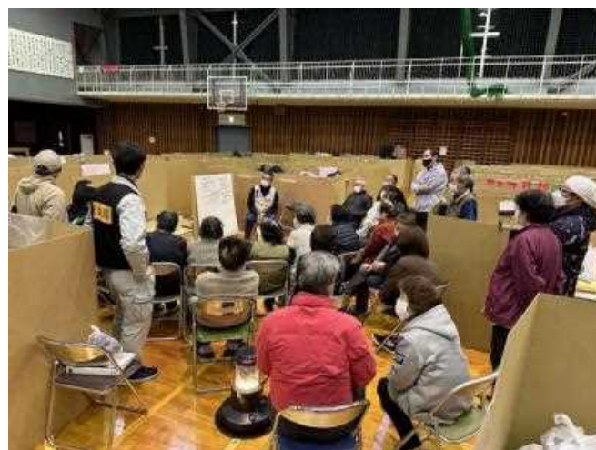
避難者の方々との“お話し会”