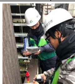
住家被害認定調査