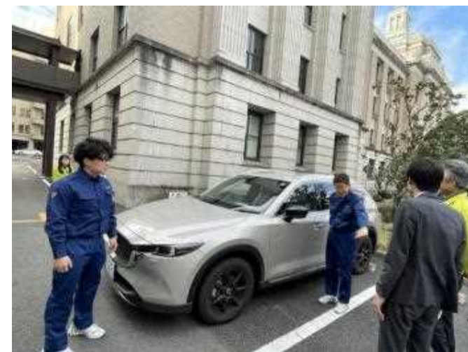
総括支援チーム (第4次派遣) 出発