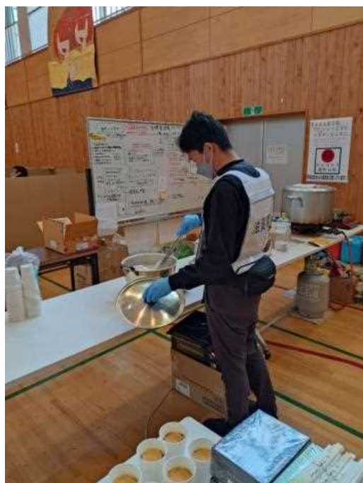
避難所での給食支援