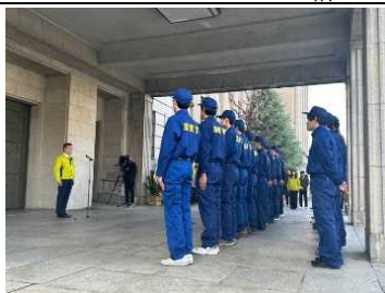
能登町への職員派遣の出発式