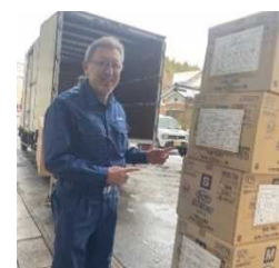
支援物資を受け取る能登町長