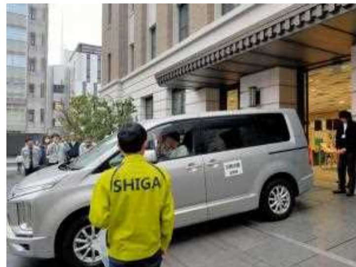
DHEAT (第3班) 出発