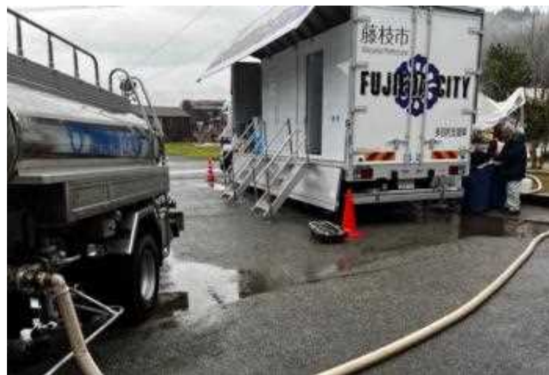
シャワーへの給水 (企業庁給水車)