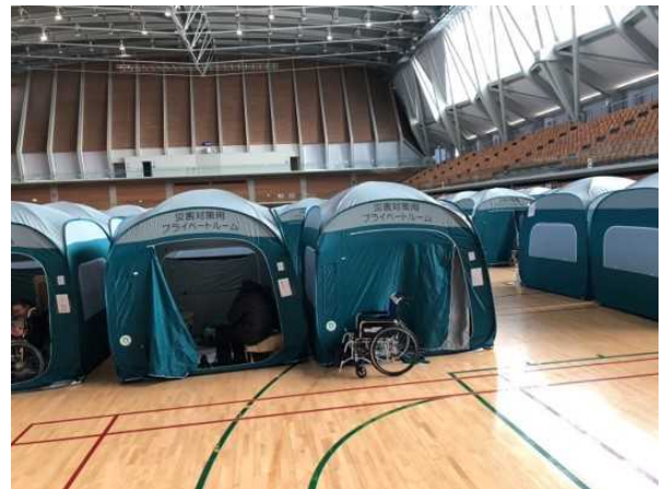
1.5次避難所(いしかわ総合スポーツセンター)