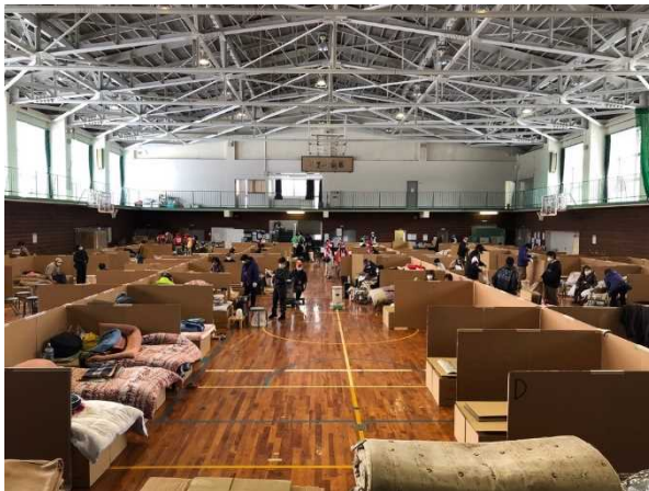
能登町内の避難所の状況(松波中学校)