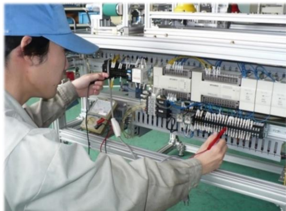
メカトロニクス科