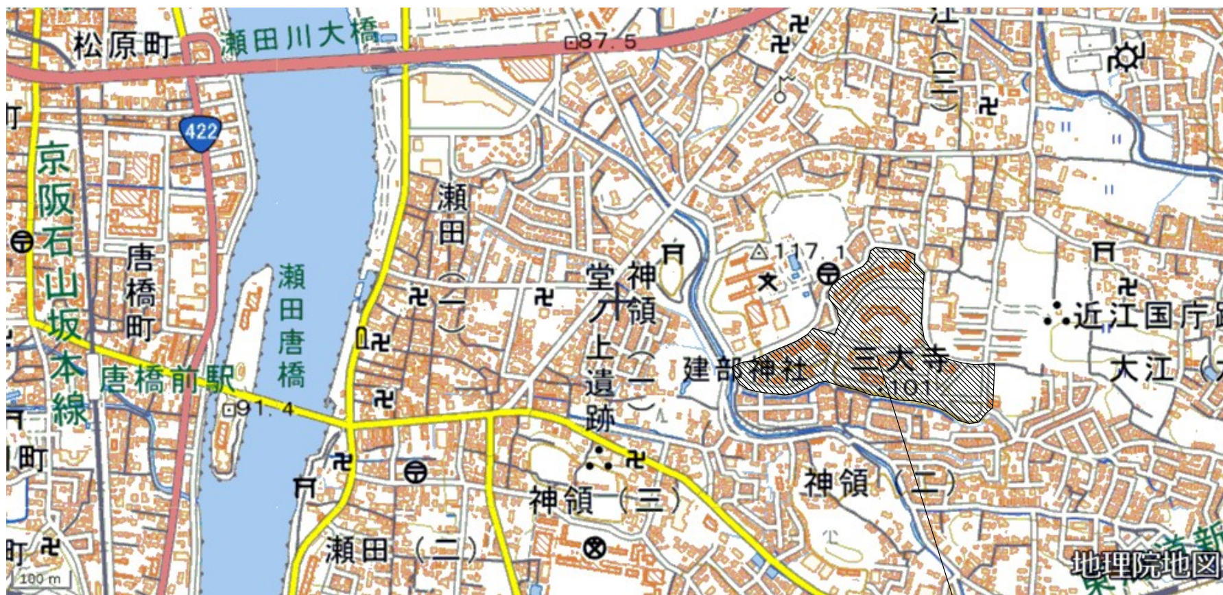
神領（大津）県営住宅