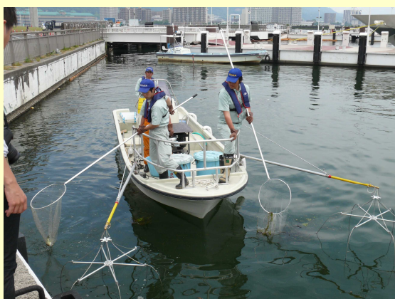
電気ショッカーボート「雷神」

これまでの調査研究から、外来魚駆除方法の一つとして、産卵期に電気ショッカーボートを用いて外来魚を捕獲することが効果的であることが明らかとなってきました。