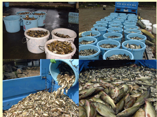
回収された外来魚

外来魚駆除促進対策事業などで捕獲した外来魚を回収し、魚粉原料として有効利用を行っています。事業を実施している滋賀県漁業協同組合連合会に対して経費を補助しています。なお、この事業に対しては別途、全国内水面漁業協同組合連合会からの支援を受けています。