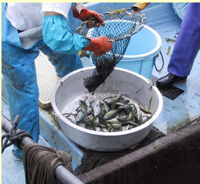
エリで捕獲された外来魚

エリ、刺網などを用いて漁業者が行う外来魚の捕獲駆除に要する経費(390円/kg)を補助しています。これに加えてニゴロブナ稚魚などを捕食する小型のオオクチバスを駆除します。さらに、瀬田川洗堰より上流で捕獲数が急増しているチャネルキャットフィッシュを駆除します。令和4年度は年間捕獲目標量を85トンとし、事業を実施する滋賀県漁業協同組合連合会に対して経費を補助しています。これらの事業に対しては別途、全国内水面漁業協同組合連合会からの支援を受けています。