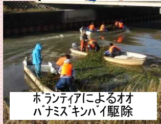
ボランティアによるオオバナミズキンバイ駆除