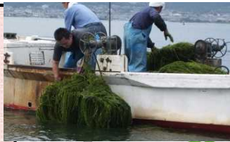
水草刈取(根こそぎ除去)