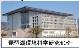
琵琶湖環境科学研究センター