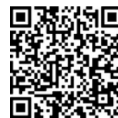
一般参加申込 QR コード