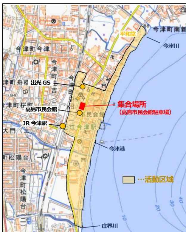
環境美化活動区域

https://ttzk.graffer.bsninet.asp.lgwan.jp/pref-shiga/smart-apply/surveys/0090282799734280040