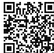
アンケート QR コード