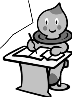
滋賀県の イメージキャラクター うおーたん