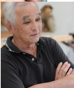
「山女原棚田ボランティア委員会」