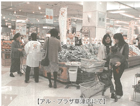
【アル・プラザ草津店にて】

こだわり滋賀ネットワーク会員による滋賀の農水産物PR隊が、滋賀県内の量販店の食品売場で、県民から県民への口コミで環境こだわり農産物をはじめとする近江の野菜のPR活動を実施しています。