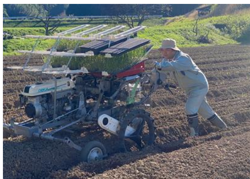
タマネギの定植作業