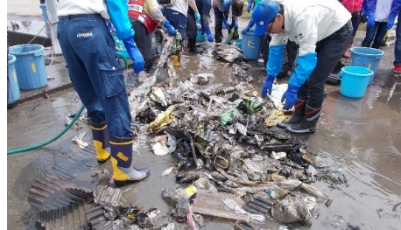
琵琶湖のプラスチックごみ実態把握調査(令和元年6月 赤野井湾)