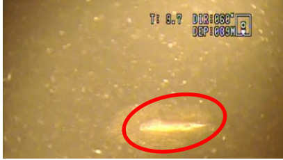
全層循環の未完了に伴う北湖深水域の貧酸素化によるイササの死亡(令和2年9月)