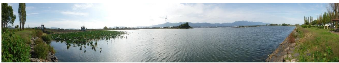
東岸から赤野井湾を見る (パノラマ写真)