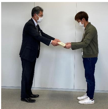
甲賀農業農村振興事務所長 による伝達表彰