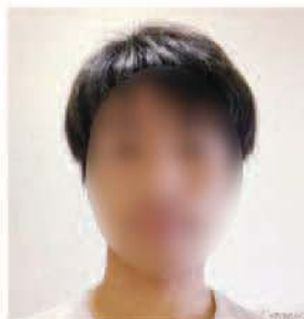
水口東中学校 第11期生 神戸大学