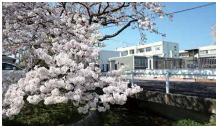
県立守山中学校に在籍している生徒の出身小学校(郡市町別) ~令和2年度 在籍生~

※上記の表は、県立守山中学校から守山高校へ進学し、卒業した内部進学生2クラスのみでの状況です。 ※守山高校全体の進路状況については、守山高等学校のホームページをご覧ください。