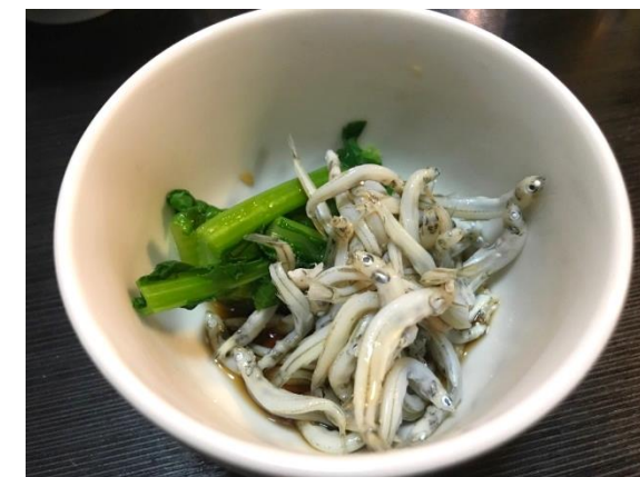
漁獲が好調だった氷魚(12月)