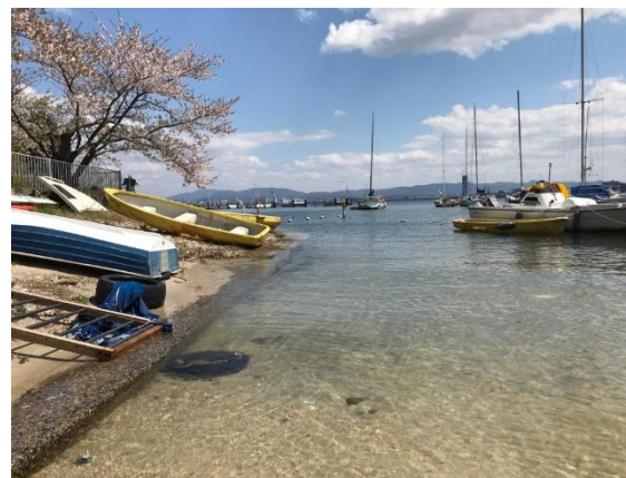
透明度の高い南湖(4月)

このほかにも、6月には守山市の赤野井湾において湖底ごみの実態把握調査を実施しました。回収されたごみのうち、プラスチックごみの割合は体積比で74.5%であったこと、またその内訳としては袋類、農業系プラスチックごみが多いことが分かりました。プラスチックごみは時間をかけて分解され、生態系等への影響が懸念されているマイクロプラスチックとなる可能性があることから、今後効果的な削減対策等を検討することが必要です。