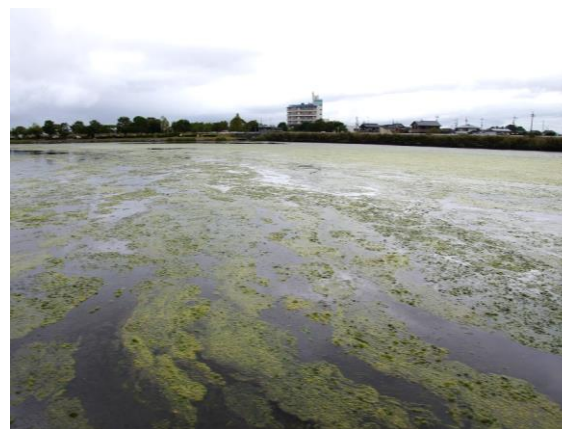
南湖で晩夏に急増した水草(10月)