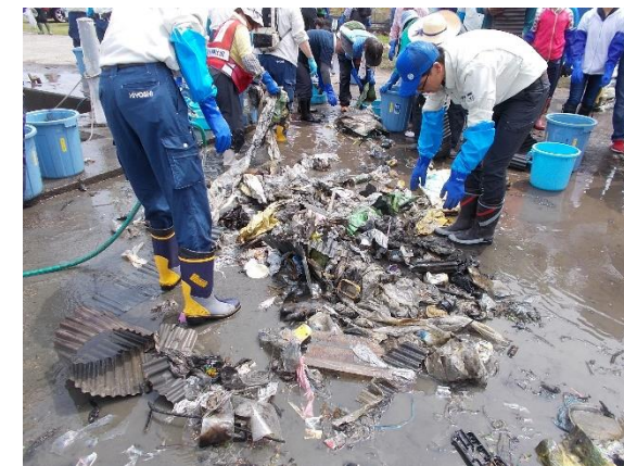
赤野井湾の湖底ごみの回収(6月)