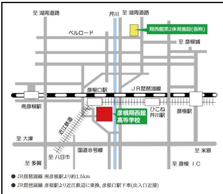
[滋賀県立彦根翔西館高等学校]