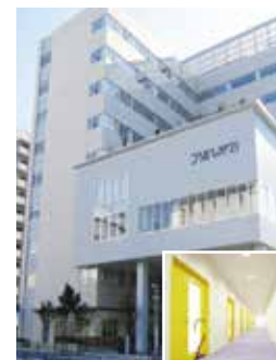
創業準備 オフィス・ 創業オフィス