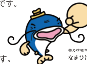
普及啓発キャラクター なまひげ先生

元気で、働く意欲のあるおおむね60歳以上の高齢者が、「自主・自立・共働・共助」の理念をモットーに豊かな経験と能力を活かし、自主的に社会参加することにより、生きがいを高め、活力ある地域社会づくりに貢献することを目的とする団体です。