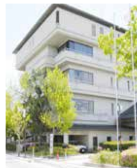
滋賀県立 SOHO ビジネスオフィス