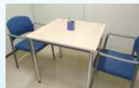
▲カウンセリングルーム