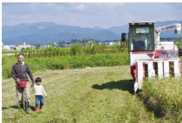
▲ 除草後、広々とした農地。

コンバインなど、機械の運転こそ経験はありましたが、自然栽培自体は未知の世界。慣行農法とは栽培方法が全く異なるの