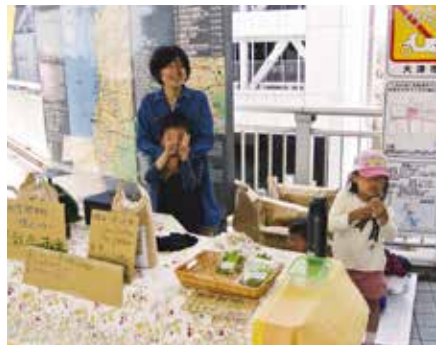
▲ 一家揃って朝市に参加。

たくさんありますね。しかし、出会う人の心地良さやお米の美味しさは、自然栽培ならではの魅力だと感じています。妻も「アパレルから飲食までいろいろな仕事をしてきたけど、その中でも農業が一番楽しい!」とはりきって手伝ってくれています。味を第一に、まずは一反八俵を目標に頑張りたいですね。