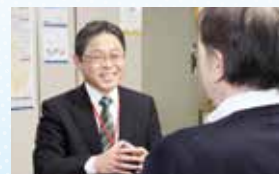
▲個別コンサルティング