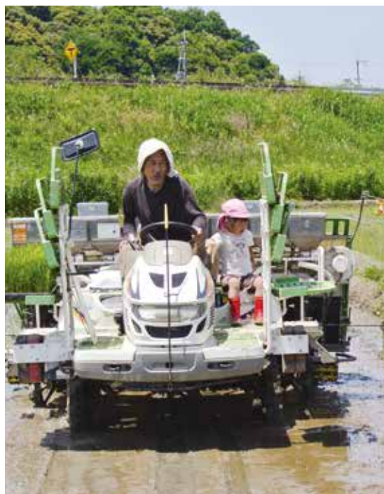
▲ 愛する我が子と田植機に乗ることも。

実家はお米農家ですが、兄が後継したため、私は東京でパソコンのソフトウェアを開発する会社に勤めていました。当時は起業もしましたが、肌に合わず地元・彦根に帰省、実家の慣行農業を手伝うことにしたんです。次第に「無農薬のお米の味」に興味をわき、5年程で独立を決心。48歳の時、知り合いに120アールの農地を借り、お米の自然栽培を始めました。