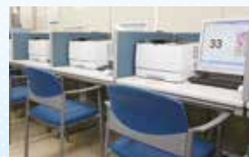
▲求人情報検索端末