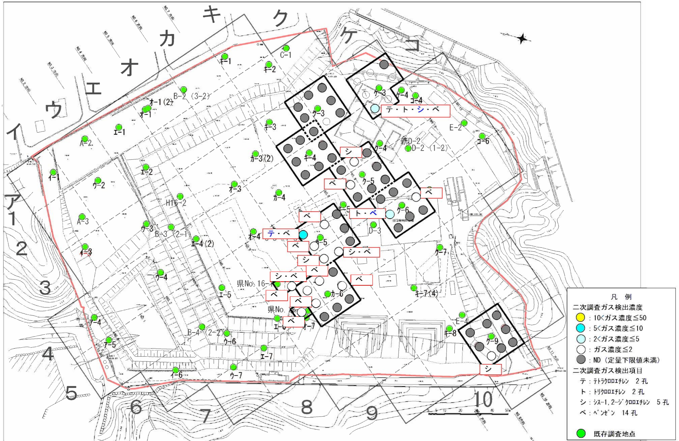
図-1.3.1 二次調査の孔内ガス (VOCs) 検出地点位置図

VOCs について、二次調査の孔内ガス調査で検出された地点を図-1.3.1に、孔内ガス測定結果・廃棄物土分析（溶出試験）の結果を表-1.3.1に整理した。