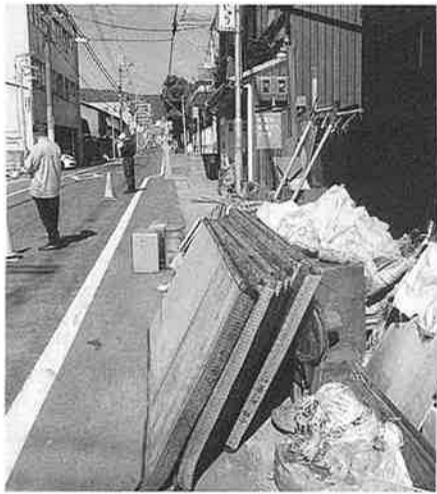
泥にまみれた家財道具(堅田町)