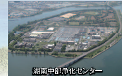
湖南中部浄化センター