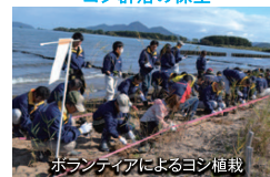
ボランティヤによるヨシ植栽