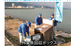
外来魚回収ボックス