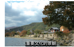
重要な文化的景観