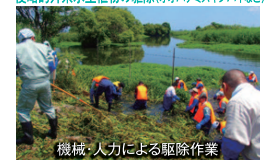
機械・人力による駆除作業