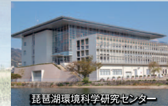
琵琶湖環境科学研究所