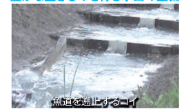
魚道を遡上するコイ