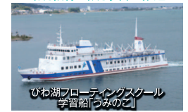
びわ湖フローティングスクール 学習船「つみのこ」