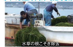
水草の根こそぎ除去