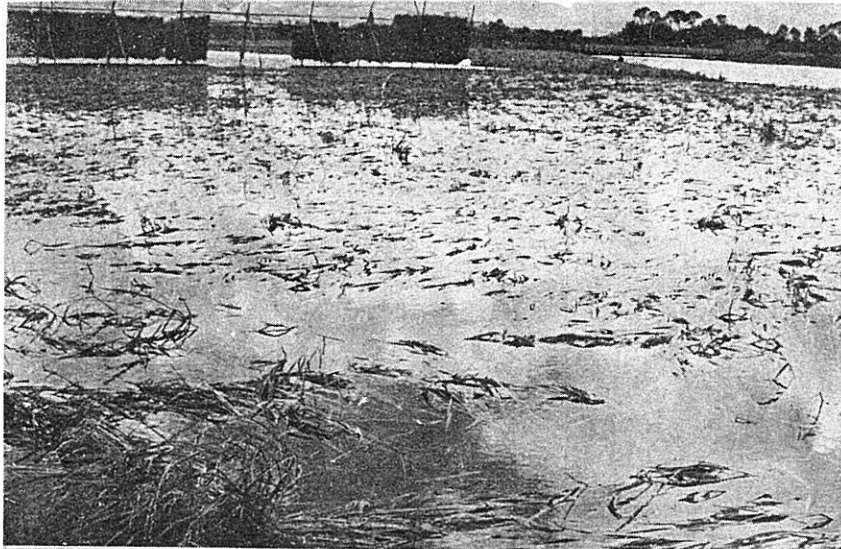
稲田の冠水(新旭町)