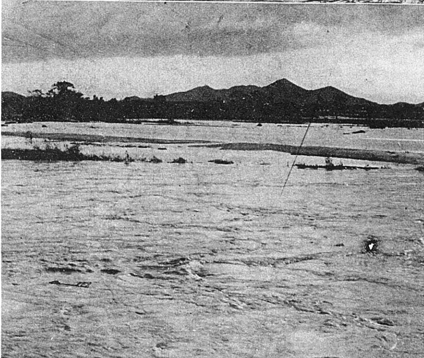
野洲川の決壊(守山町新田)