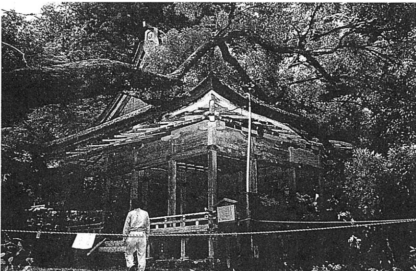
▲日吉大社の境内にある白山姫神社の拝殿 (国の重要文化財) の屋根が倒木で大破