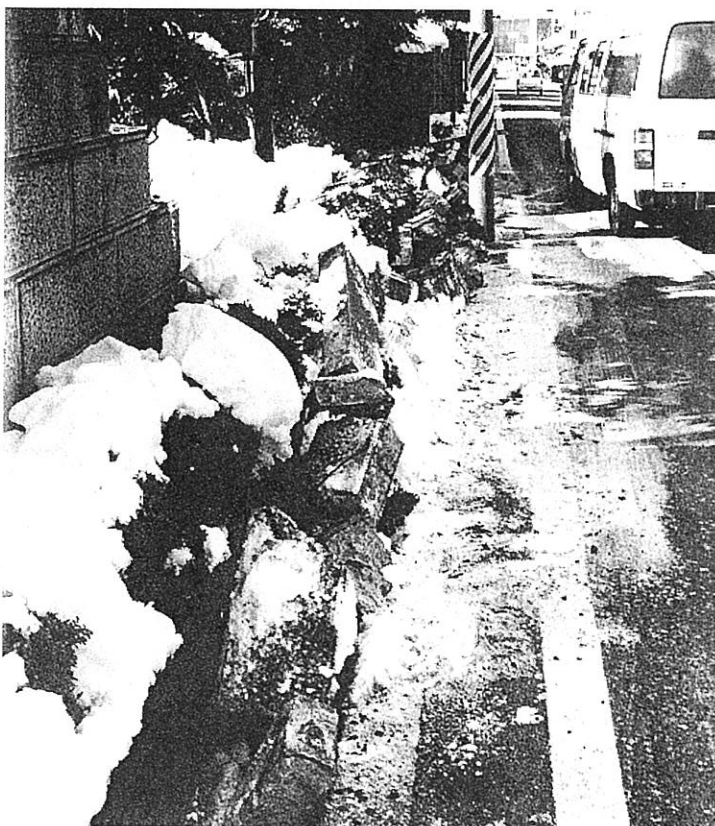
▲ 地震で倒れた石塀 (長浜市)