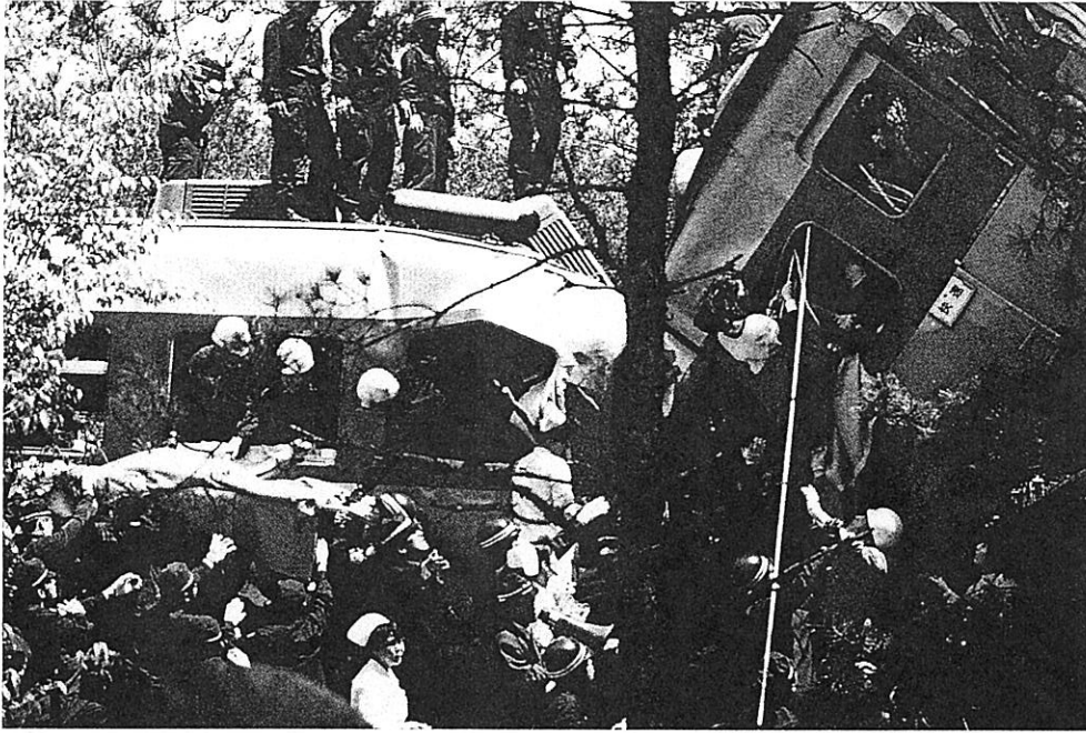
▲車内にとり残された乗客の必死の救助