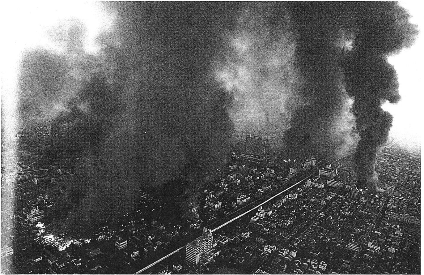
▲地震後に起きた火災 (兵庫県)