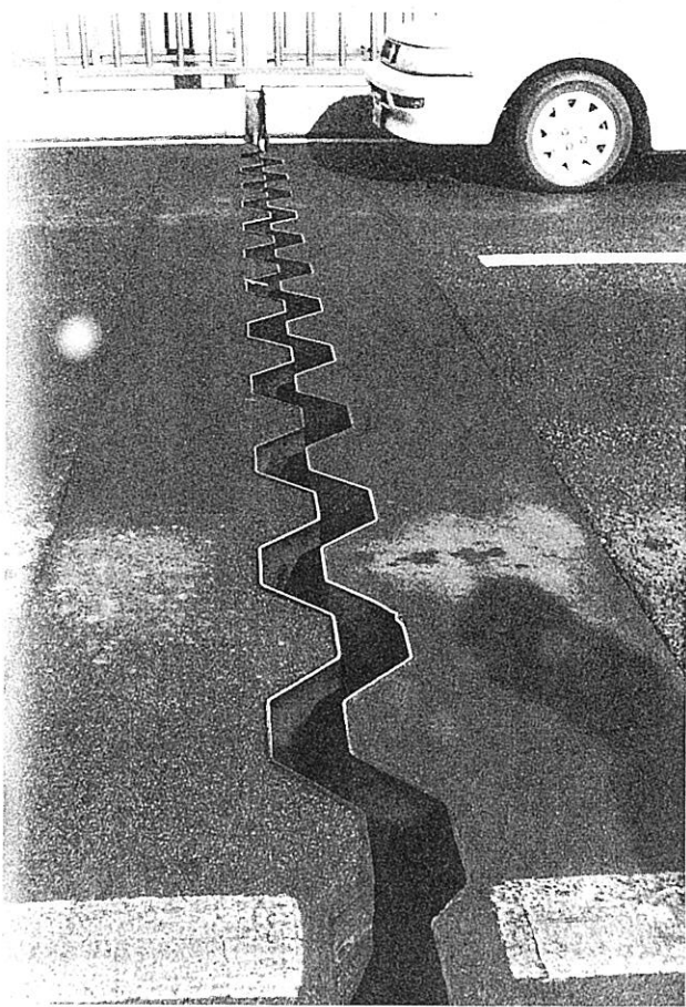
▲ 10cmほど開いた近江大橋のジョイント部分