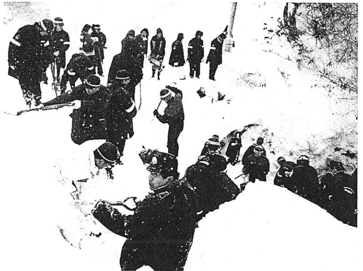
▲救助活動を行う伊吹町の救助隊員ら (平成9年1月26日)