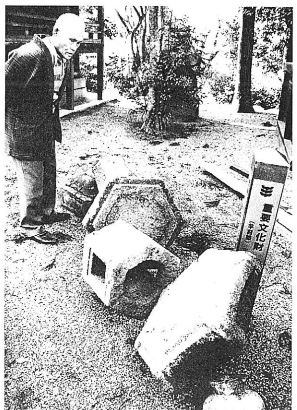
▲ 倒れた三大神社の石灯ろう (草津市)