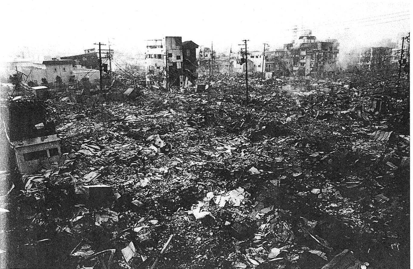
▲地震後の火災で焼け野原となった街