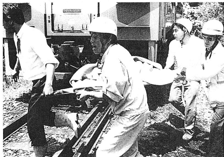
▲乗客を救急車へ運ぶ消防隊員