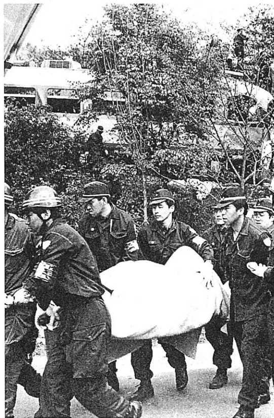
▲救出した乗客を担架で運ぶ県警隊員