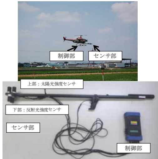
図1 無人ヘリ観測システム