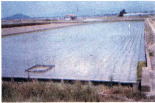
図1 ほ場A (農業試験場試験ほ場)