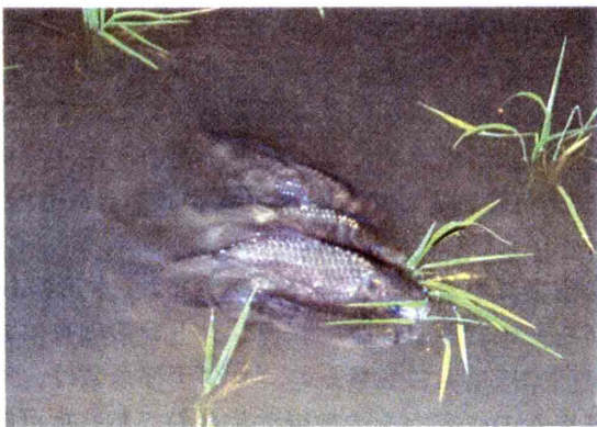
図3 水田内にて夜間に産卵するニゴロブナ親魚。卵のほとんどは田面泥上にばらまかれた状態になった。