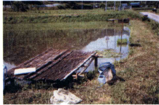
図2 ほ場B (米原町番場)