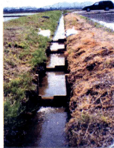
図2 堰上げ工の設置状況。