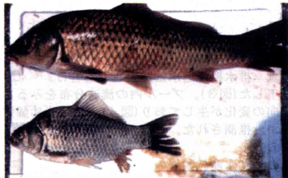
図4 階段式堰上げ工を遡上したコイとギンブナ。5月25日に採捕した個体。前々日から前日にかけての降雨にもなって遡上したと考えられる。

*3: Cp: コイ, Hw: ギンブナ, Ng: ニゴロブナ, Nm: ナマズ。他に、メダカとドジョウが採捕・確認された。