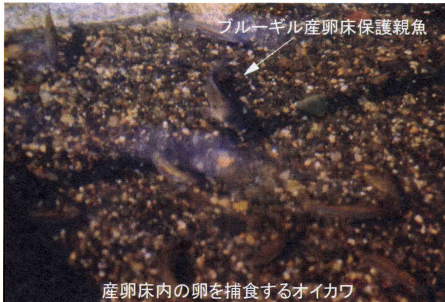
図2 オйкаワの群に攻撃されるブルーギル産卵床.