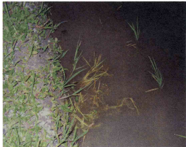
図2 ニゴロブナ卵が産着された稲や雑草。