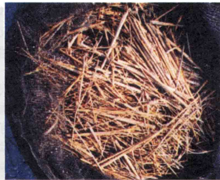
図5 実験終了後(湖水浸漬4日目)の稲わら。