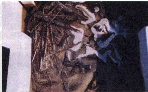
図4 実験終了後(湖水浸漬4日目)の柵内の稲わら。