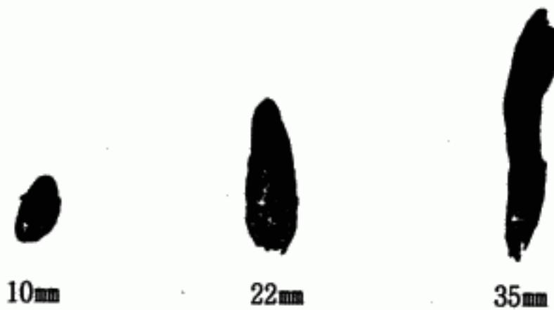
図1 花茎の採取ステージ

培養条件は、25°C, 5,000~6,000lx, 16時間日長とした(以下、培養試験は同条件とした。)