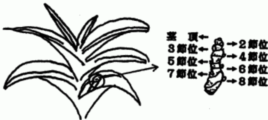
図2 花茎の採取位置と供試腋芽の節位