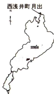
図1 西浅井町月出地先の調査地点.