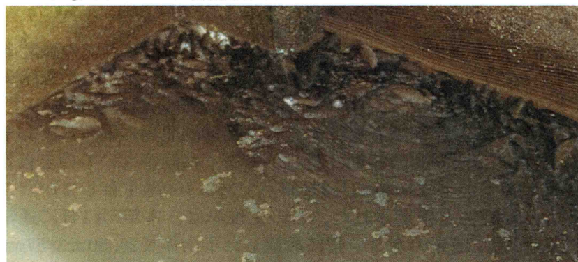
図3 水路で鼻上げるフナ.