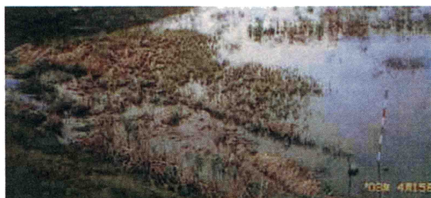
図1 灌水区のうち産着卵がみられた一帯 (03/04/15)