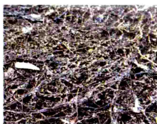
干出したホンモロコ卵