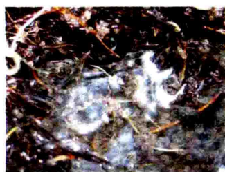
水際に産み付けられたホンモロコ卵