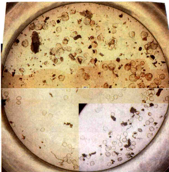
図1 飼育開始時(下半円)と35日目(上半円)の貝殻の比較. 円は96穴マイクロプレートのウェル(画像測定用の合成写真).