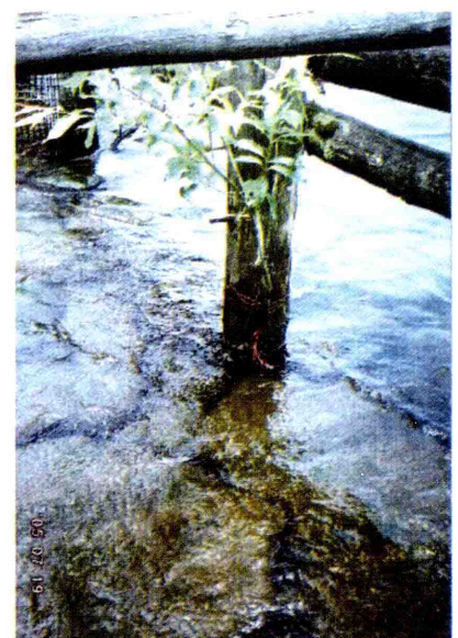
ヤナギ植栽試験約2ヶ月後