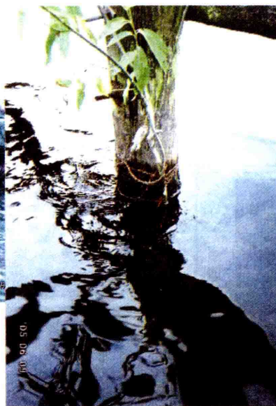
ヤナギ植栽試験2週間後