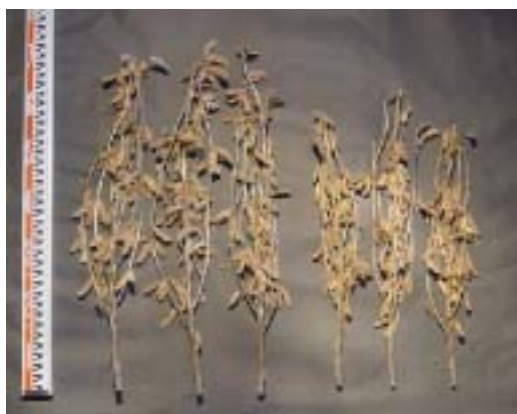
1 高さごとの着莢の分布割合 (H17奨決; 10株調査)