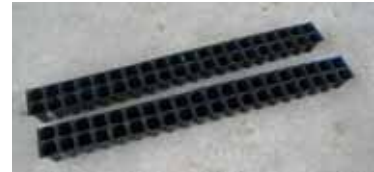
図1 栽培槽断面(上)と切断後の小トレイ(下: 200穴セルトレイ)