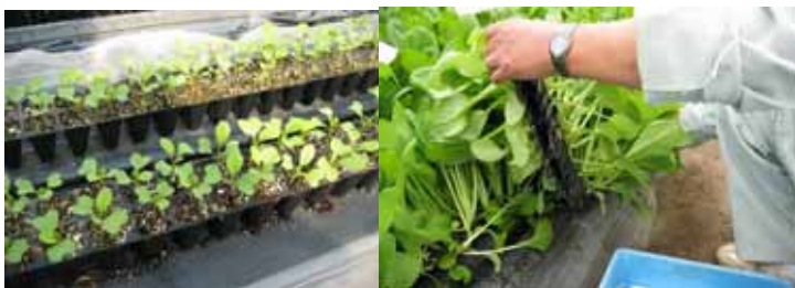
図2 置床直後(左)と収穫時(右): 寒冷紗敷設時

y 枯死葉, 黄化葉および矮小株を除いた可販収量。ミズナは枯死葉・矮小株が認められなかったため, 総収量 = 上物収量とした。