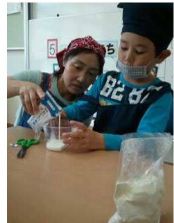
小学部「せいかつ」の様子

本校は、昭和44年(1969年)4月に滋賀県立養護学校という名称の本県最初の養護学校として設置されました。昭和50年には、滋賀県立八幡養護学校と校名を変更し、肢体不自由児を対象とする養護学校でした。平成20年4月に校地を野洲市小南に移転し、知肢併置の養護学校として再スタート。現在は上記の地域が校区となっています。本校には小学部・中学部・高等部が設置されています。また、通学が困難な児童生徒のために寄宿舎が設置されています。そして、野洲市北桜にある「びわこ学園医療福祉センター野洲」に在園する学齢児のうち、障害が重く本校に通うことのできない児童生徒のために学園の敷地内に北桜校舎が設置されています。