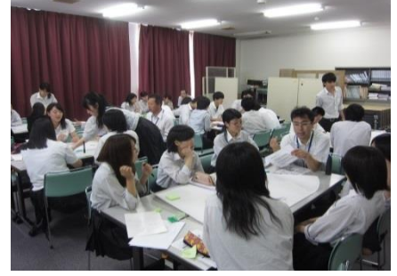
各グループの意見交換