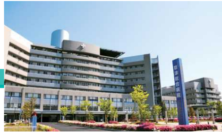
滋賀県災害拠点病院 日本医療機能評価機構認定病院 (V.6) 滋賀県地域がん診療連携支援病院

医師数：98名 指導医数：34名（指導医講習修了） 一日平均外来患者数：617.3名 一日平均入院患者数：612名