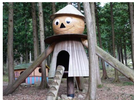
森の中には かわいい遊具がたくさん！